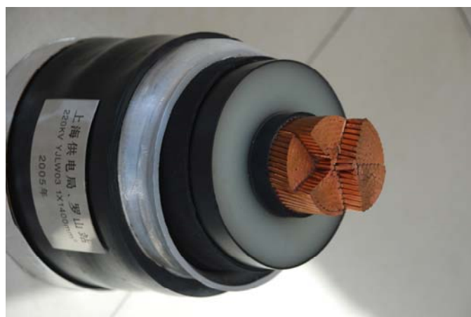
Cables OF y extruídos hasta 500 kV

Inno Representaciones cuenta con una amplia oferta de cables de Alta Tensión, ofrece una de las primeras fábricas de cables de China. Establecida en 1945, Shanghai Cable es actualmente un gran conglomerado industrial con una amplísima gama de productos potencia a los sectores industriales y domésticos.